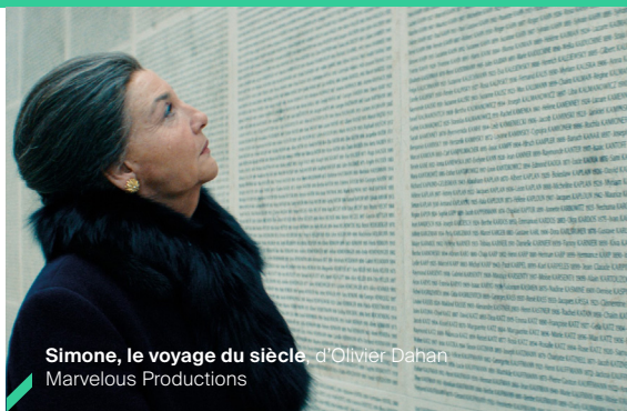
Simone, le voyage du siècle, d'Olivier Dahan Marvelous Productions

soit 28% de la production française (fictions, documentaires et animations).